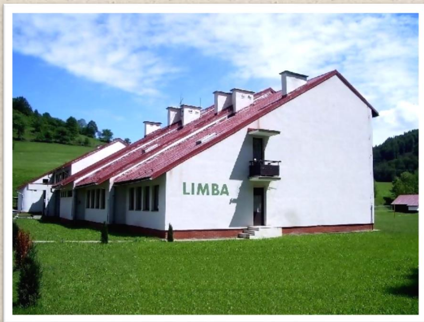
Chata Limba, Bystrá 118, 97701 Slovensko, termín 18. 7. - 25. 7. 2015