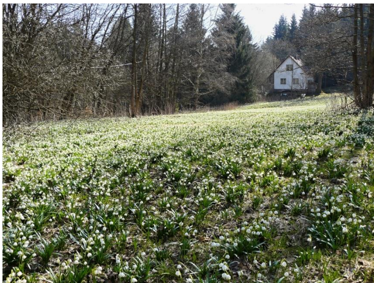
Jaro na Jestřebích horách (ilustrační foto)

26.06.21 | Obec a Infocentrum Lánov, Lánov, okr. Trutnov, 16. ročník, Infocentrum Lánov