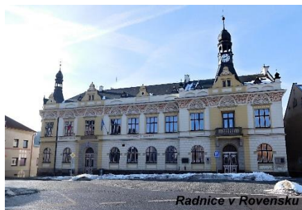
Radnice v Rovensku

V sobotu 20.2.2021 nezůstal jsem doma. Regionova Královéhradeckého kraje (žlutozelená), která jela z Hradce Králové do Turnova, nabídla mně možnost přepravy mezi